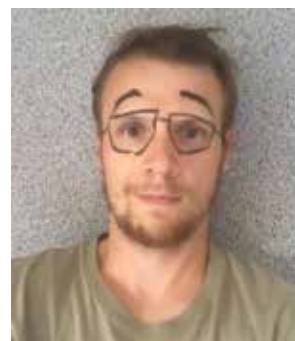
Sylvain Euriot Graphiste